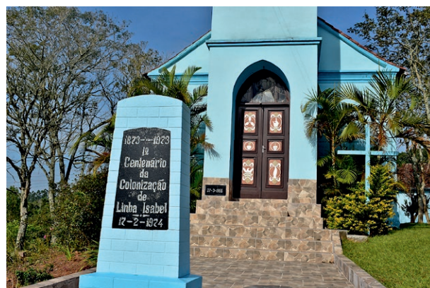
Kirche mit Hinweistafel zur europäischen Besiedelung in einem Stadtteil von Venâncio Aires (Rio Grande do Sul, Brasilien), einem Erhebungsort im BOBR-Korpus.