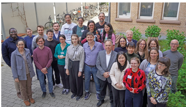
Gruppenfoto der Workshopteilnehmenden.