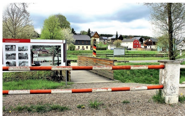
Das ehemals geteilte Grenzdorf Mödlareuth nach der Wende, einer der Erhebungsorte im SPIG-Korpus.

Mit dem aktuellen Release gehen auch neue und verbesserte Funktionalitäten in der DGD einher. Diese Neuerungen betreffen unter anderem die Verbesserung der Video-Navigation (u.a. Frame-genaue Navigation) sowie Verbesserungen bei der Sortierung von Suchergebnissen .