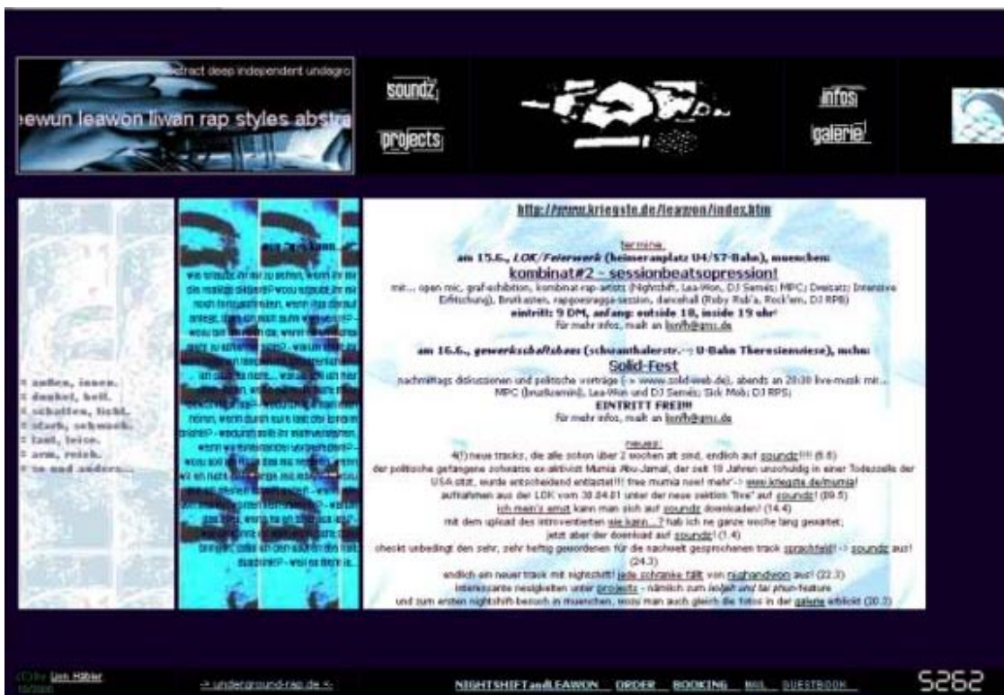
Abbildung 2: www.kriegste.de/leawon (April 2001)