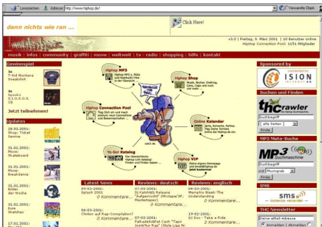
Abbildung 4: www.hiphop.de (April 2001)